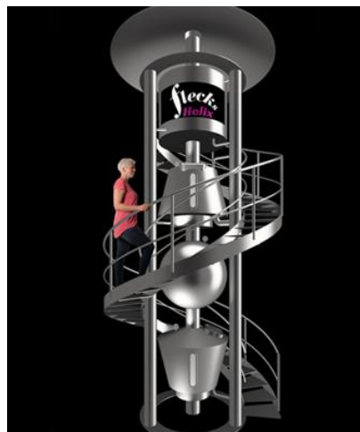
FLECKS HELIX Пивоварня-башня 5 гл

Соберите свою готовую пивоварню при помощи нашего модульного конструктора: