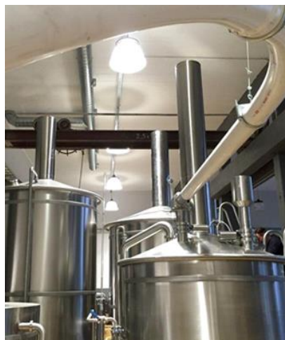
Автомат Пивзавод 3-5-10-20-30-50 гектолитров