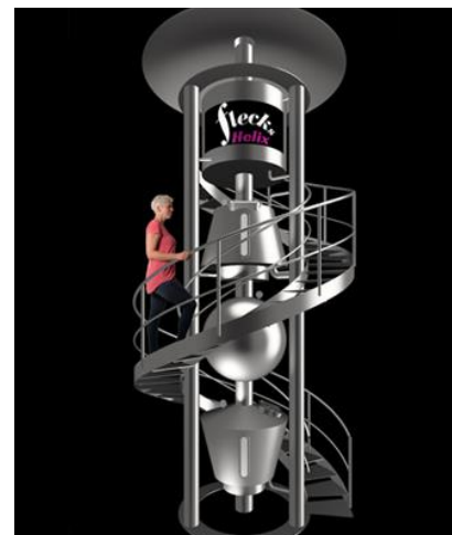
Flecks HELIX Дизайнерское решение 3 & 5 гектолитров

Укомплектуйте Вашу пивоварню самостоятельно при помощи нашей модульной системы: