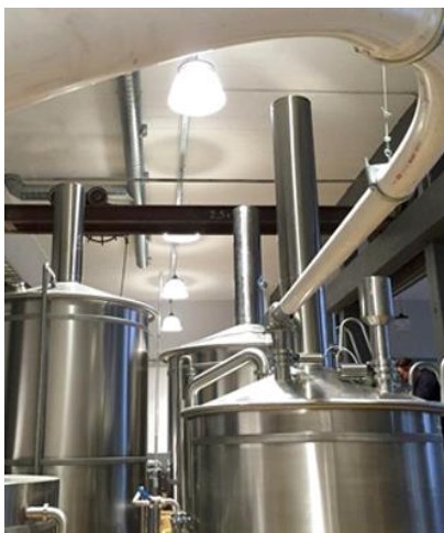
Крафтовая пивоварня FLECKS 3-5-10-20-30-50 гл