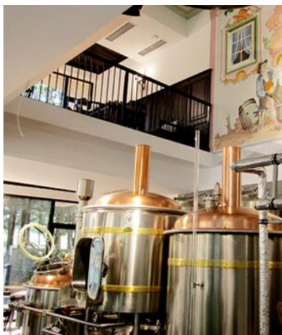
Классическая ресторанный пивоварня FLECKS 3-5-10-20 гл